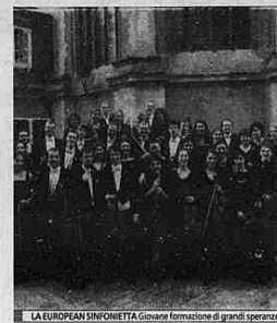
LA EUROPEAN SINFONETTA Giovane formazione di grandi speranze

La Settimana Musicale di Stressa sono un festival ad ampio raggio, e fra i tanti appuntamenti dedicati a svariati generi non trascurano la musica d'oggi: questa sera, all'Auditorium La Fabbrica di Villadossola (ore 21), propongono una novità commissionata a un compositore italiano: «Parafarsi sull'ocra», del 44enne Luigi Abbate. Il pezzo, per orchestra da camera, è stato spuntato da due «Menies» per pianoforte composte da Béla Bartók nel 1910: due brevi, intensi e suggestivi