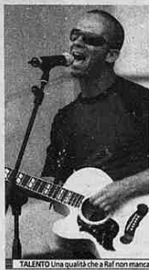
TALENTO Una qualità che a Raf non manca

musica italiana. Un uomo che nella vita artistica e personale ha passato di cotte e di perdue e tuttavia non ha mai perso la giusta vena poetica unita a un'indubbia capacità di scrittura musicale. Il prezzo dei biglietti è di 13 euro e per scenografia e scaletta il pubblico verrà ampiamente ripagato. Partendo dallo show due megacherni situati ai lati del palcoscenico proporranno immagini di vario tipo: dal video dell'artista a bellissimi clip realizzati dagli studenti del Dams dell'Università Cattolica di Brescia coordinati dal docente Domenico Liggeri. Per i fan si prospetta una bella serata con le hit della carriera. Raf sarà fra gli ospiti del Festivalbar in onda su Italia uno giovedì con la canzone «Oasi».